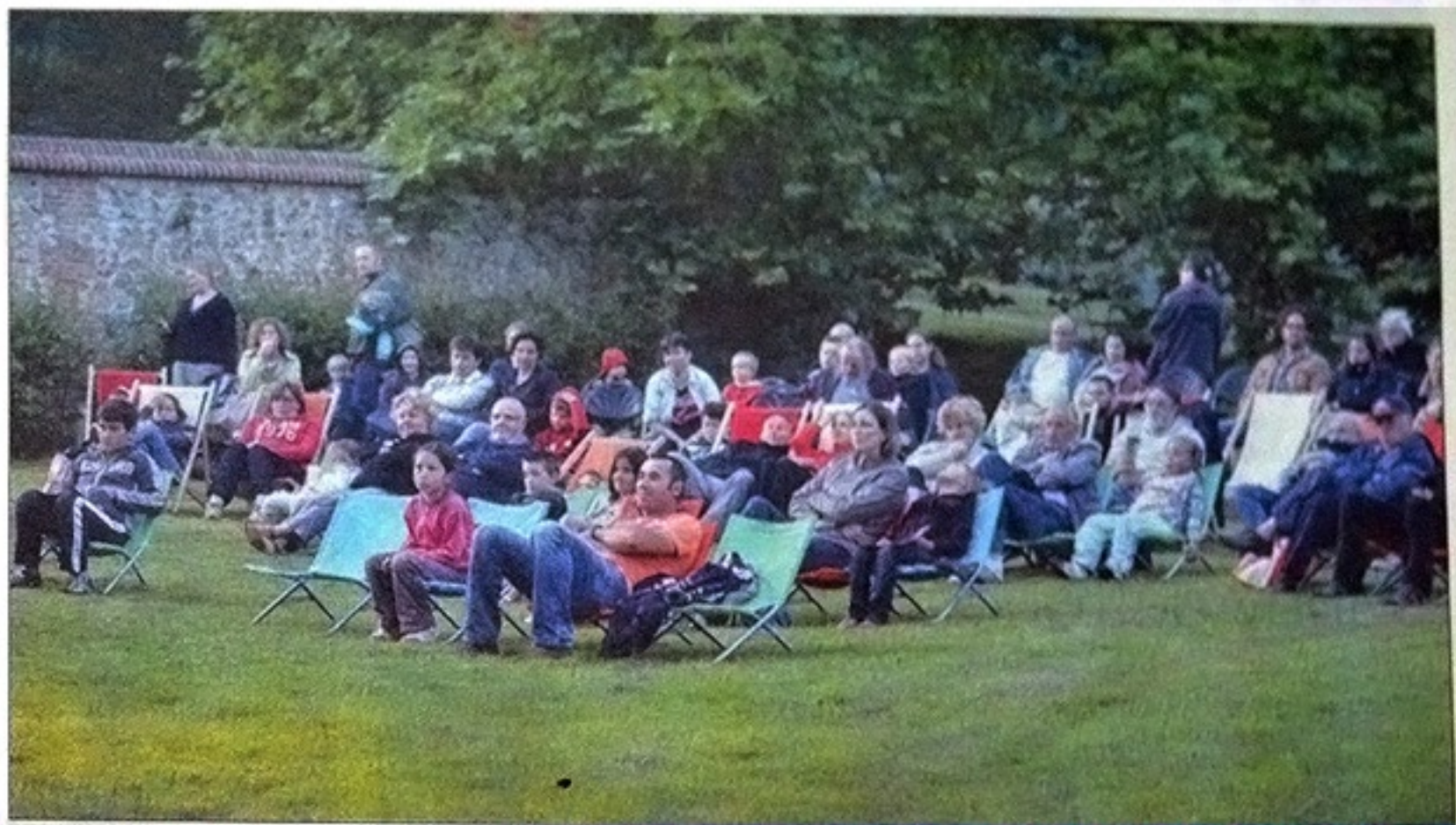
Parents et enfants : tous sous le charme du ciel qui leur apporte rêverie et bonheur lors de cette manifestation gratuite.

ou bien des différentes phases lunaires. À 22 heures, Henri-Marc Bécquart, écrivain, réalisateur et conteur de sciences professionnel, proposait une séance d'observations des étoiles au rythme d'un spectacle de contes et d'images projetées. Allongés dans des